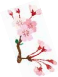
第 1 回クラス平均点 H22.8.30 実施

今年度は漢字コンクールのテキストを大学受験対応型の新たなものになりました。以前のテキストに比べて難しくなりましたが、各クラスは上記のとおり、努力の成果を発揮してくれました。一年生は第一回の平均点一三七・八から今回一五一・六点上がりました。二年生も第一回一五六・八から今回一六〇・九点まで伸びました。今回の満点は一年一組岩崎翔くんただ一人でした。お見事です。次年度も同じテキストで漢字コンクールを実施します。生徒の皆さんは、漢字コンクールの意義を大切にして、今から満点目指して勉強してください。